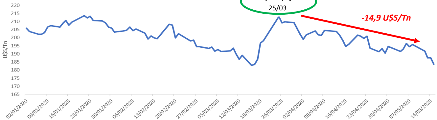
GRÁFICO 1: CHICAGO- Evolución 2020

Mercados: en lo que va del 2020 y en medio de la pandemia que afecta al mundo, el trigo ha sido la commodity que registró una menor caída en su cotización. En particular, luego del máximo de 213,1 U$S el 25 de marzo impulsado por la demanda externa, el trigo perdió más de 14,9 U$S en el último mes, dada las proyecciones de mayor producción a nivel mundial.